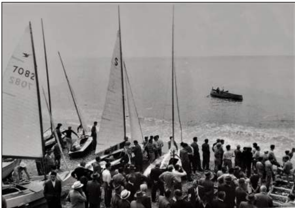
La spiaggia di "Priaruggia", nei pressi di Genova negli anni 50, con le barche pronte a prendere il mare per una regata, al largo già pronte il gozzo che dovrà posizionare le boe di percorso.