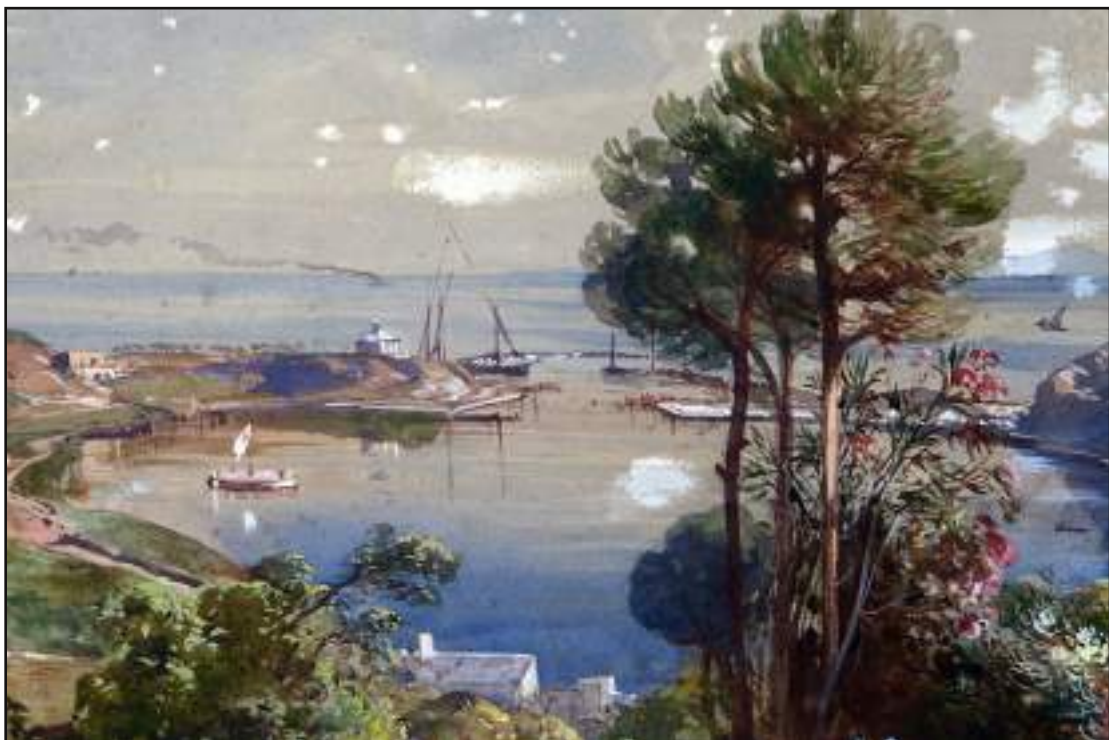
Il porto di Ischia durante i lavori di completamento (1854). G. Gigante, olio su tela, Caserta, Palazzo Reale.

sopralluoghi, delinearono il piano consistente nell'aprire "una nuova foce di palmi 500 fra' colli Boschetto e S. Pietro, garantendosi con un molo a pietre perdute lungo circa palmi 700" l'accesso all'imboccatura. Altri lavori riguardavano il cavamento del "fondo di quel lago alla profondità di palmi 12" nonché la costruzione di "una limitata banchina per lo sbarco" della famiglia reale. In tutto l'opera sarebbe venuta a costare 50.000