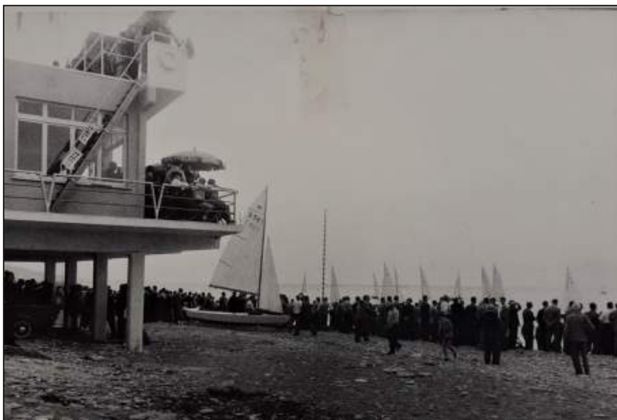
Spettatori in attesa della regata sulla spiaggia di Voltri negli anni Cinquanta. Al centro si nota il pennone di allineamento per la partenza traguardato con l'ultima boa di partenza dal palco giuria posto sulla plancia del circolo Costaguta .