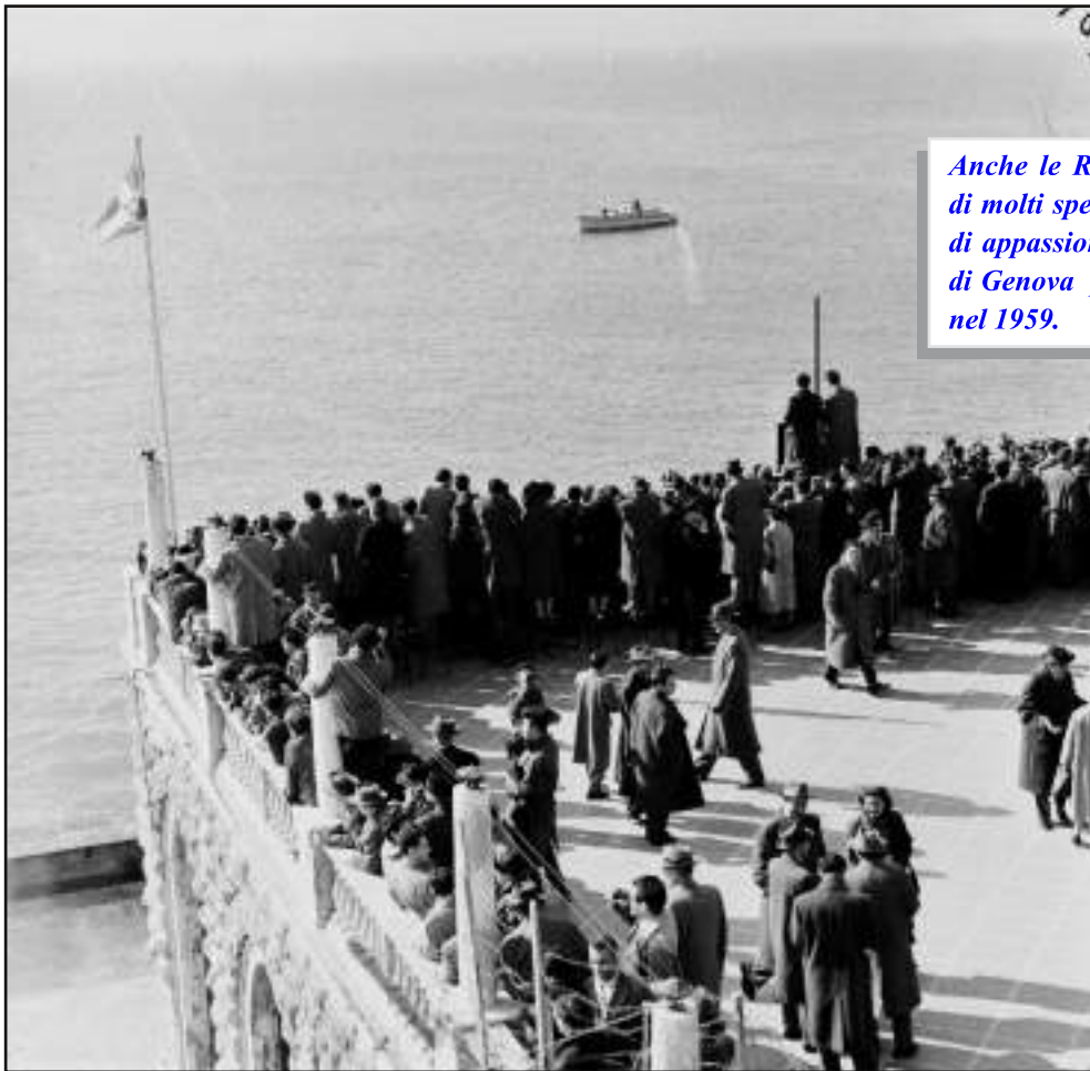
Anche le Regate di Genova godevano di molti spettatori, qui un gruppo folto di appassionati nella terrazza del Lido di Genova per le regate internazionali nel 1959.