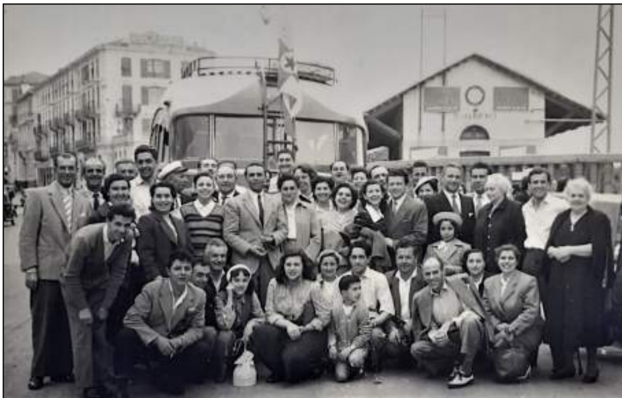
Un gruppo di spettatori con l'autobus, al seguito delle regate a Sanremo per il Campionato Zonale.