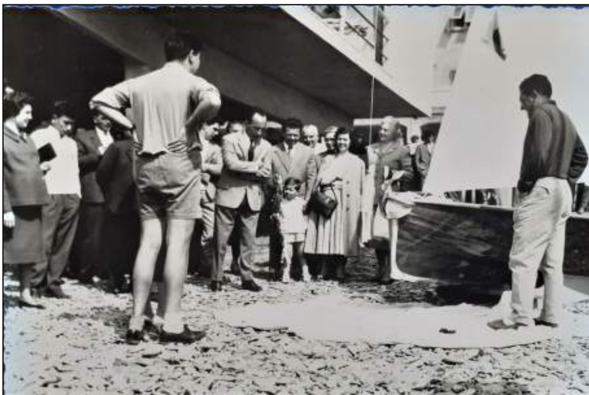
Battesimo di una barca sulla spiaggia era l'Aprile del 1959 Sulla prua si nota l'ancora dove si infrangerà la bottiglia di spumante per il primo varo.