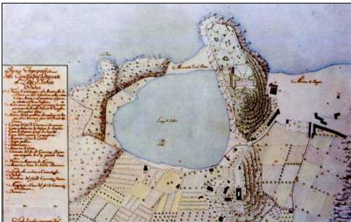
Piano Topografico delle Campagne adiacenti il Lago d'Ischia (1790). Carlo Vanvitelli, disegno acquerellato, Napoli Biblioteca Nazionale.

Il commercio marittimo dell'isola di Ischia ha antiche origini e lo dimostra il fatto che gli ischitani, già nel XIV secolo, godevano della franchigia per lo scarico delle merci nel porto di Pisa. (2) All'inizio del XVII secolo molto attivo era il commercio del vino con lo Stato Romano e la Liguria, mantenuto dai commercianti del comune di Forio. In questa località vi era un piccolo molo che, a causa della fatiscenza raggiunta, nel 1654-55 dovette essere sottoposto ad un consistente restauro. Altro approdo da cui partivano numerose derrate, e tessuti di tela per la Sardegna, era quello di S. Restituta nel quale potevano ancorarsi navi e galere. Chi traeva un profitto da questi traffici erano i d'Avalos, Marchesi del Vasto, che tra i diritti feudali esigevano anche quello del "falanccaggio d'Ischia" (diritto di ancoraggio), che consisteva nel pagamento di cinque Grana per ogni barca che partiva da Procida per andare ad Ischia e viceversa. (3)