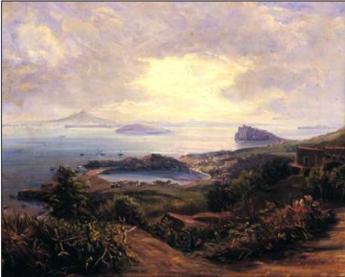
Una veduta del Lago di Ischia prima ancora che iniziassero i lavori per la realizzazione del porto. J.C. Dahl, olio su tela, Collezione privata.