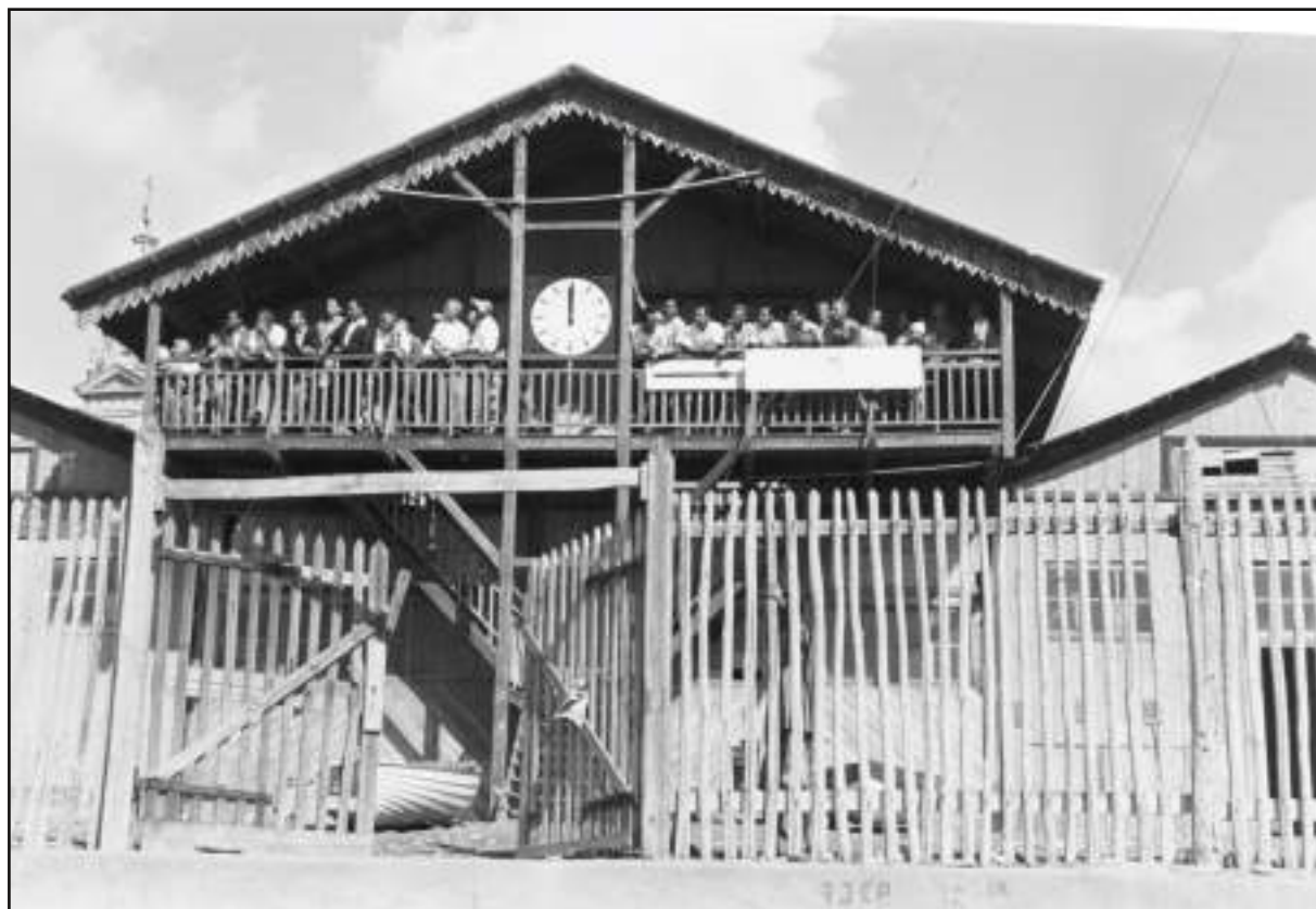
Immagine del palco giuria negli anni Trenta allestito sul terrazzo del Cantiere Costaguta si nota è esposto la freccia del senso del percorso e l'orologio per i tempi della partenza...

In ogni località della costa si costituirono gruppi di appassionati che sotto la sapiente guida di qualche costruttore professionista, sfruttando le serate invernali, costruivano nei magazzini prospicienti le spiagge i loro piccoli gioielli.