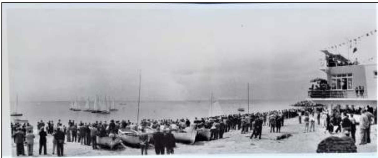
La partenza della Coppa Stalder A Genova Voltri nel 1954 con gli spettatori sulla spiaggia in attesa della partenza, sopra il circolo Costaguta si nota il palco della giuria che sovrintende alle operazioni.