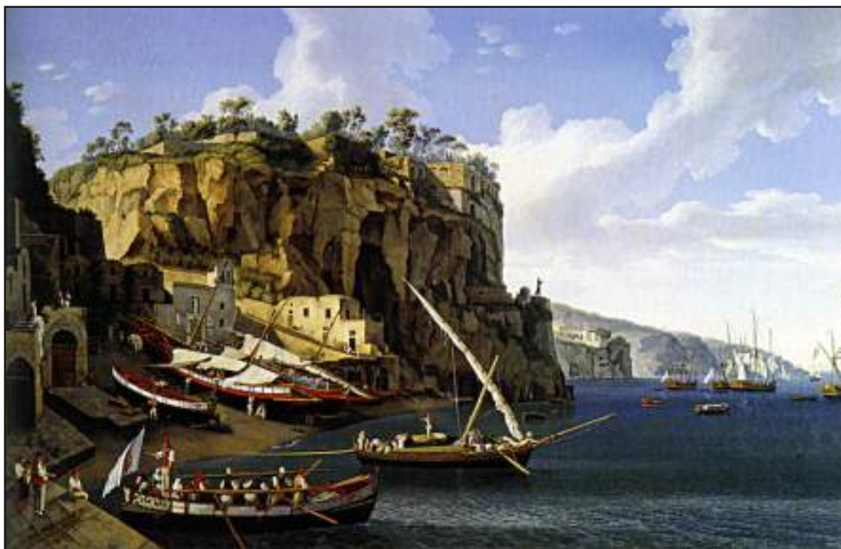
Sorrento. L'approdo di Marina Grande. Sulla destra si vedono delle polacche che attendono di caricare le merci. J.P. Hackert. olio su tela, Caserta, Palazzo Reale.

Tutta la costiera sorrentina, da tempo immemorabile, ha sempre avuto una larga fascia della popolazione dedita alle attività marinaresche (costruzione di navigli, vele e cordame) nonché alla navigazione di piccolo e medio cabotaggio e, a partire dal terzo decennio dell'Ottocento, anche oceanica. La costituzione geomorfologica della costa della penisola sorrentina, essenzialmente alta e frastagliata, in passato non ha consentito la costruzione di un porto vero e proprio, pertanto sia nella marina di Sorrento che nei suoi cosiddetti terzi di Piano (marina di Cassano) e Meta (marina di Alimuri), gli indigeni sfruttavano come approdo quelle strette fasce sabbiose presenti sotto costa. Anche la pesca era molto diffusa e la pratica di questa attività portò alla costituzione di due associazioni di mutuo soccorso. La prima, fondata nel 1520, era una “ Congregazione di Marinari e padroni di barca e pescatori di palamiti ”, la seconda sorse nel 1557 e riguardava i “ pescatori della tonnara .” Anche qui le attività mercantili e ittiche erano sottoposte a diritti di falancaggio e di dogana. (1)