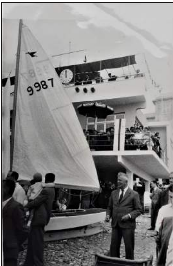
Regata a Voltri negli anni '50 la giuria è nel palco sopra il circolo durante le fasi di partenza con esposti i "palloni" e il pannello con l'orologio che indicavano i tempi per la partenza, all'epoca i cronometri subacquei da polso non erano ancora diffusi e la giuria comunicava i tempi con questo sistema visivo.