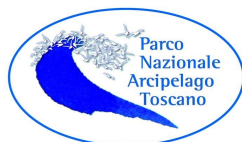
Ente Parco Arcipelago Toscano