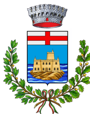
Comune di Capraia isola